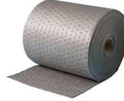
Çok amaçlı rulolar