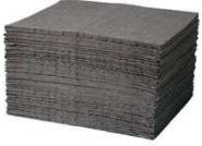
Çok amaçlı pedler

Bir karton içerisinde 100 adet absorbent ped bulunmaktadır. Bir rulo 100 absorbent ped uzunluğundadır.