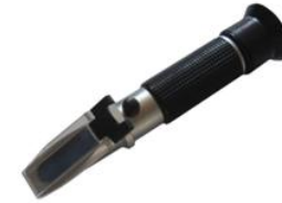
Brix Reflektometre 0-20% ATC

Ölçüm Aralığı : 0-20% Doğruluk : + / - 0,1 % Boyutlar : 27 x 40 x 150 mm Ağırlık : 175 gr. ATC : Evet